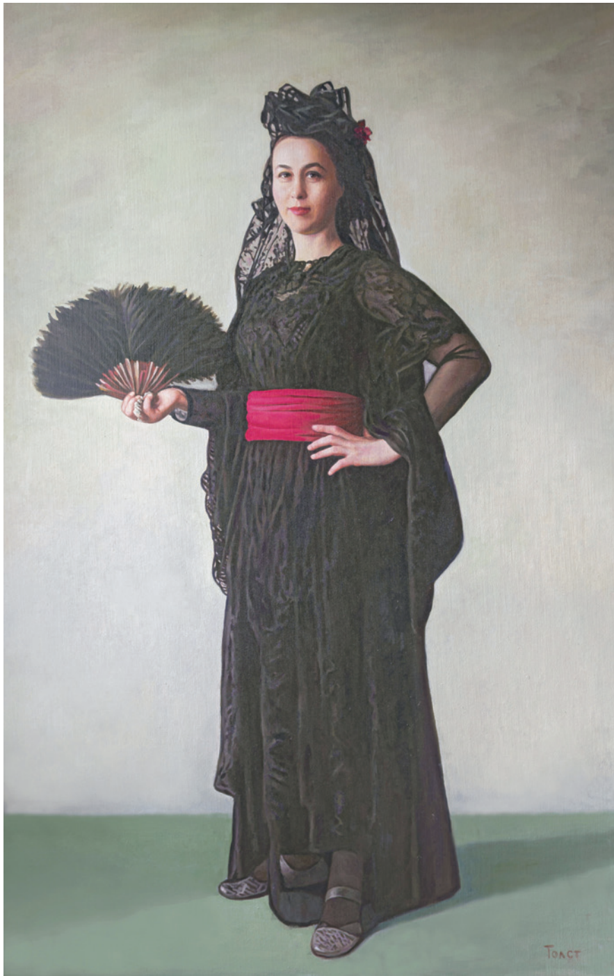
Красавица Кадиса. (Посвящение Лео Делибу).