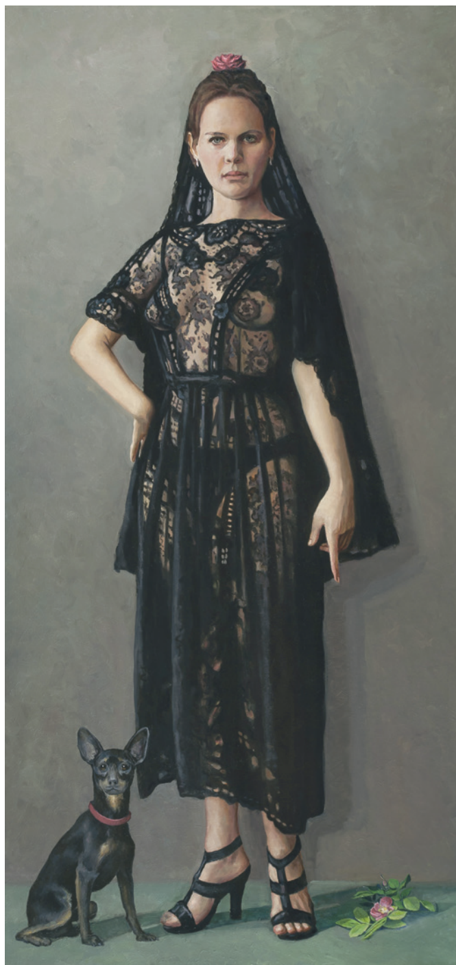
Маха. (совместно с М.В. Горщуновым).