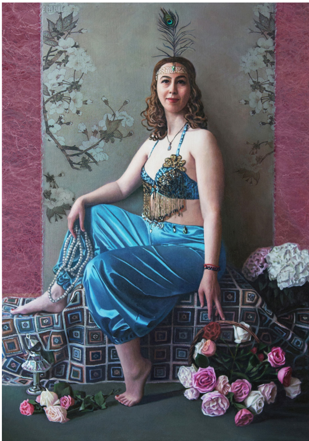
Танцовщица в цветах. (совместно с М.В. Горшуновым).